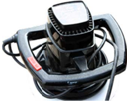
Le gros modèle

La polisseuse à cire, une orbitale de plus large surface permet de faire des merveilles sur de grandes surfaces, celle-ci coûte