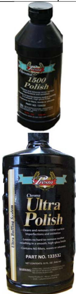
Le Chroma 1500 les deux versions

J'aime bien ce magasin et ils l'ont en inventaire sur les tablettes. À l'entrepôt Marine de Laval, Gatineau ou sur la rive sud pour ±18 à 30$ (2014) ou Canadien Tire qui commence à en avoir dans ses tablettes côté nautique on en trouve aussi sur le web a moins cher.