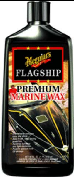
La cire à toute épreuve

La cire, Meguiar's M6332 Flagship Premium Marine Wax - 32 oz, le produit de finition et si votre sablage et compound a été bien fait, la cire c'est rapide a poser, moins d'une ½ bouteille pour un 30'.