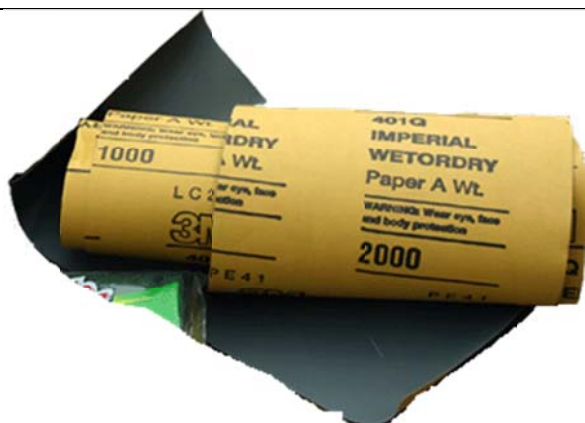
Le papier sablé

REMARQUE : Il est important d'utiliser une polisseuse avec un disque en laine naturel pour favoriser la chaleur lors du polissage. La révolution de la polisseuse doit se situer entre 1 000 & 2 500 tours minute. (Ça correspond au chiffre 2, mais surveillez quand même)