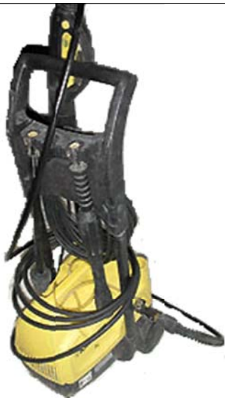
La machine à pression

La laveuse à pression un outil presque indispensable sur un bateau ou à la maison, ça fait à peu près n'importe quoi ou presque.