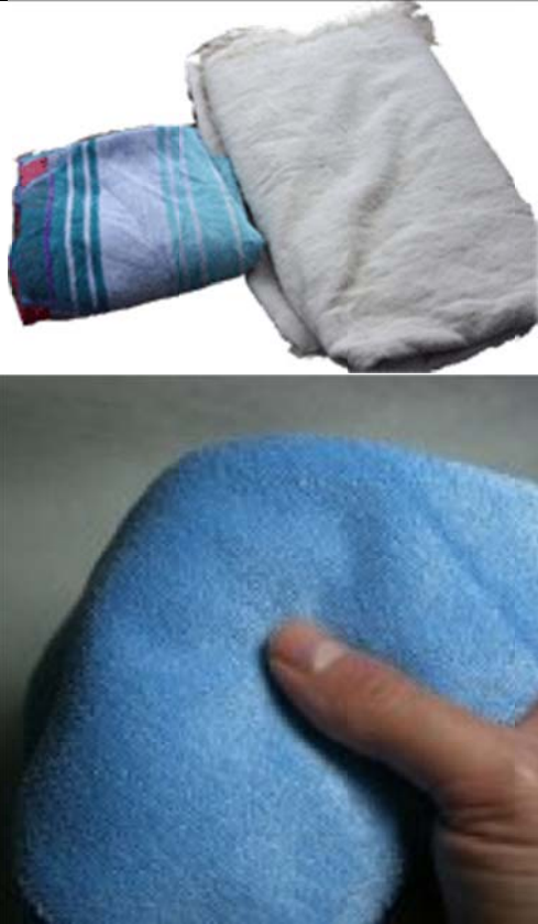
Les serviettes et microfibre.

Les linges propres, la partie importante pour la cire au final et après un compound en coton sans synthétique. Les vieilles serviettes de coton ou ratine que votre femme ne veut plus. Les serviettes microfibre ne se vendent pas cher chez Costco ou Canadien Tire.