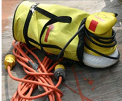
Une mini orbitale

Cirage http://www.lng.ca/bateau2007/cirage.htm