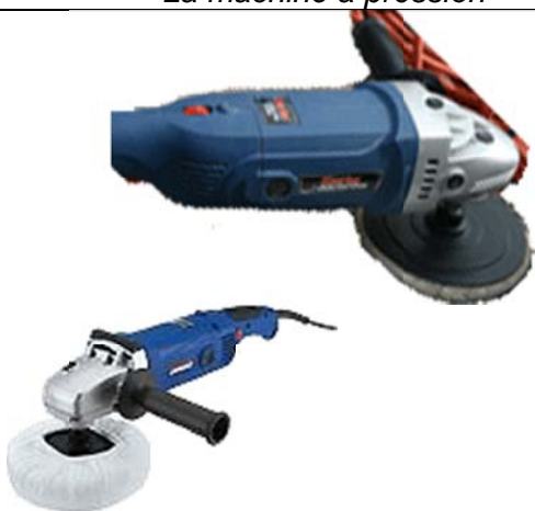
La polisseuse sous divers angles

La polisseuse rotative de 7" (±78,50 $) machine à vitesse variable et OBLIGATOIRE sans elle c'est plus pareil.